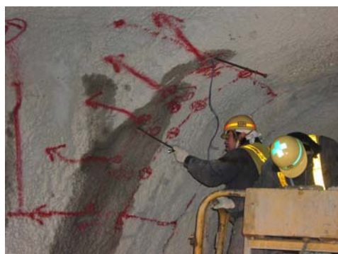
2 カートリッジ装填