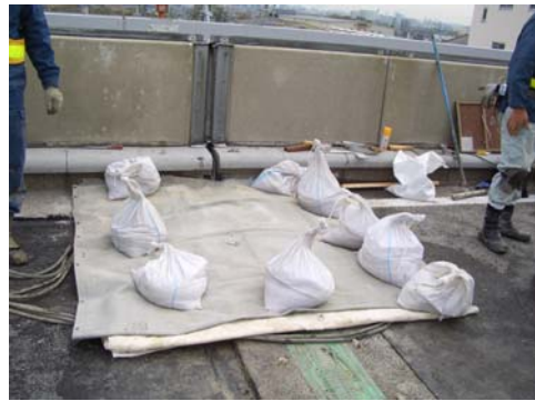
4 防爆・防音シート養生