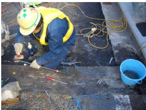
3 カートリッジ装填