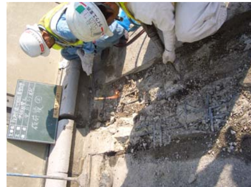
6 鉄筋ガス切断・破碎部整形