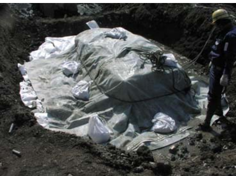
3 防音・防爆シート設置