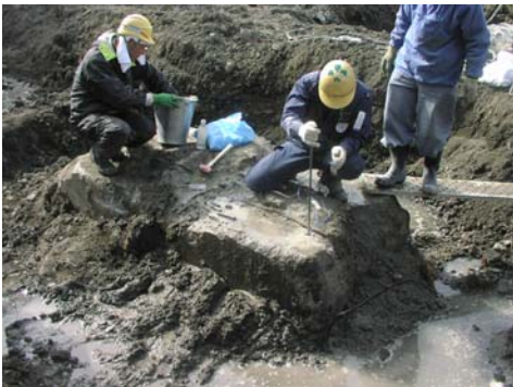
2 カートリッジ装填