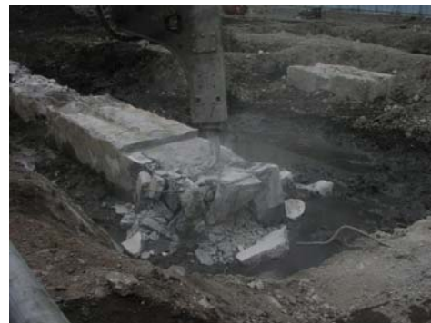
5 鉄筋ガス切断・破砕部整形