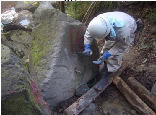
2 カートリッジ装填