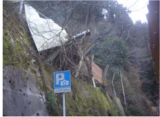
4 防爆・防音シート養生