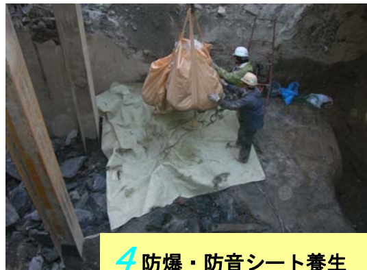
4 防爆・防音シート養生