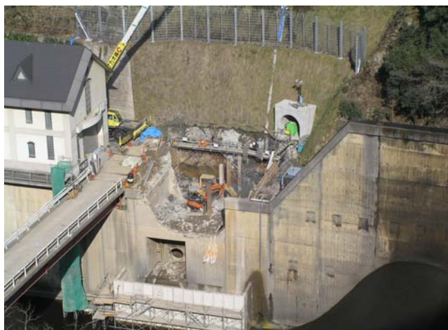
大型重機の配置困難