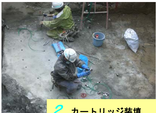
2 カートリッジ装填